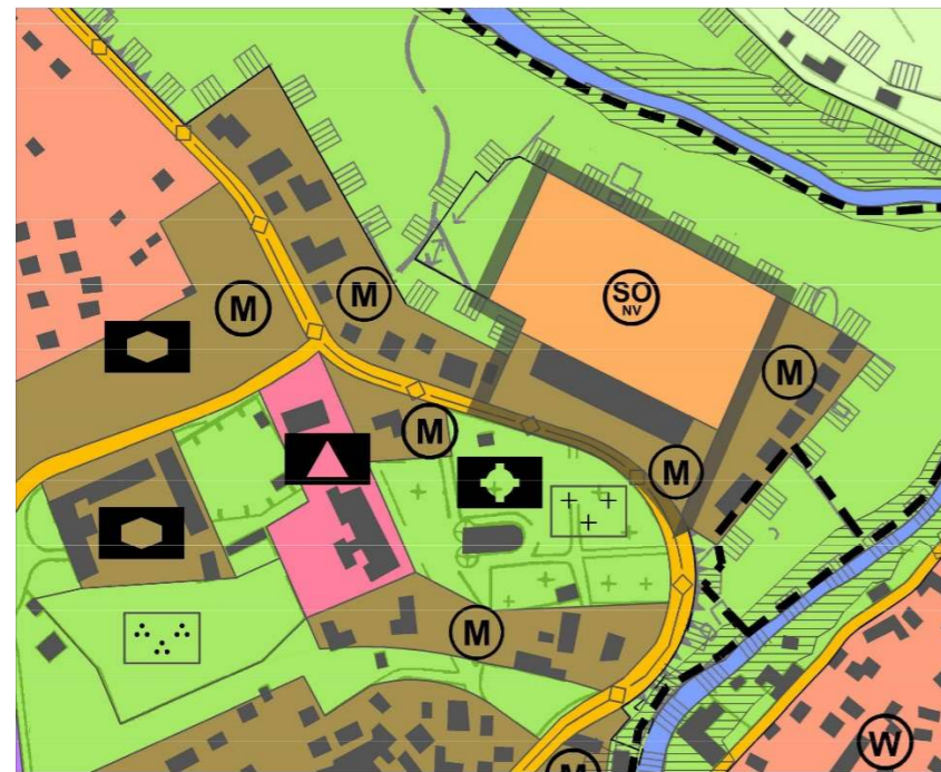
FNP - Änderung (Stand Januar 2024) 1 : 5.000