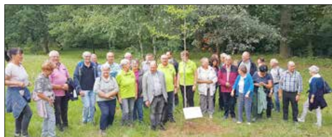
Text und Foto: Jörg Scholze

Am 04.08.2023 trafen sich über 30 Mitglieder aus unserer Kolpingsfamilie und Mitglieder der Kolpingsfamilie aus Aschendorf zum Friedensgebet am Friedensbaum am Stadtpark. Vor 5 Jahren wurde anlässlich der 18. Internationalen Kolping-Friedenswanderung in Schirgiswalde der Friedensbaum (ein Ginkgo) gepflanzt. 250 Teilnehmer der Friedenswanderung setzten damit ein Zeichen, dass der Frieden stets bewahrt werden muss. Weitere Informationen zur Kolpingsfamilie unter: vor-ort.kolping.de/kolpingsfamilie-schirgiswalde oder unter www.kath-gemeinde-mariae-himmelfahrt.de