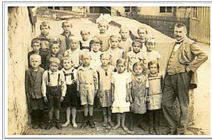
Auf dem Bild zu sehen - eine Schulklasse vor dem Treppenaufgang der Kirche in Crostau.

Im Hintergrund ist die „Alte Schule“ zu erkennen, welche im Jahr 1846 erbaut wurde und im Erdgeschoss zwei Klassenzimmer enthielt. Im Obergeschoss befanden sich, wie damals üblich, die Lehrer- und Kantorwohnungen. Aber bereits im Jahr 1879 wurde diese Schule zu klein und wurde durch einen Neubau an der Straße nach Callenberg im Jahr 1888 erweitert. Zwanzig Jahre später war die Schule in Crostau bereits achtklassig und das Schulgeld betrug fünf Mark jährlich. Zu dieser Zeit besuchten die meisten Kinder ab dem 5. bis zum 13. Lebensjahr die Schule. Die Fotografie entstand allem Anschein nach zwischen 1910 – 1919. Aufzeichnungen zufolge wurde in diesem Zeitraum der vermutlich hier abgebildete Kantor Paul Robert Häbold als 1. Kirchschullehrer eingesetzt. Die Schulen unterstanden bis zum Jahr 1919 der Kirche und das Lehramt war oftmals mit dem Kantoramt verbunden.