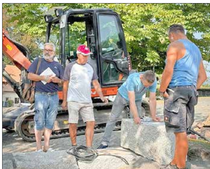
Autor Text, Autor des Projektes und Bild: Reiner J. Nagel, ostwärts-film, © April 2025