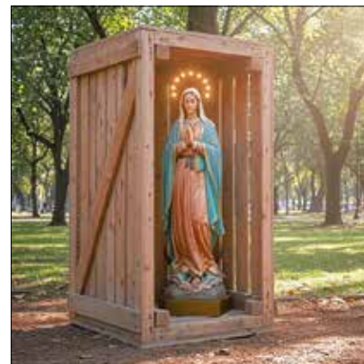
Das Bild ist von Dirk Auerbach mit KI erstellt worden.

Olaf Kramer, Dirk Auerbach, Peter Jungnitsch